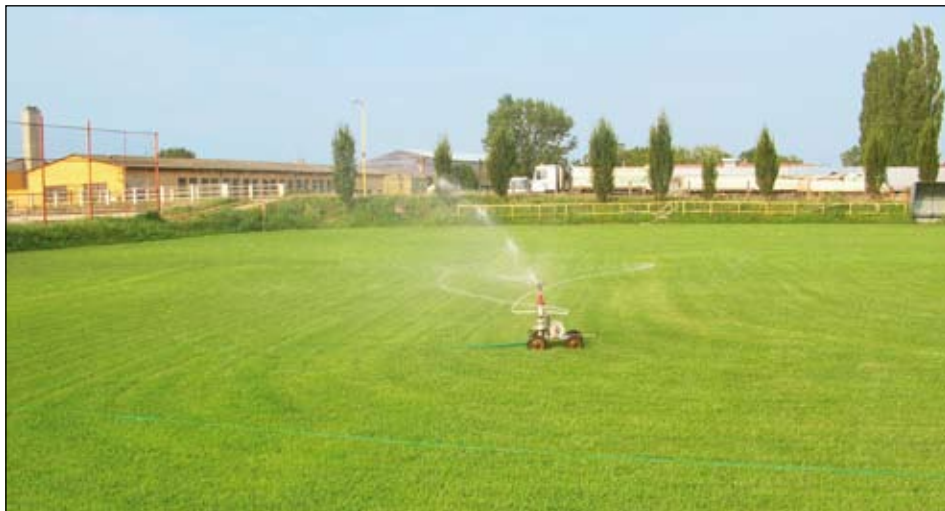
Někdy je vody málo...