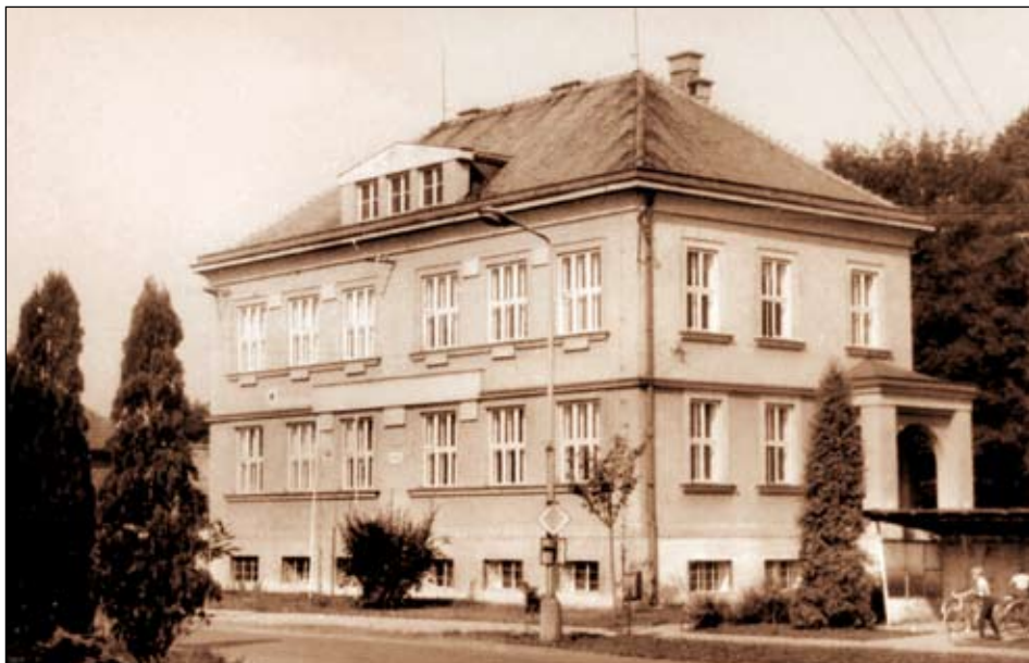
Pravčická škola v 80. letech minulého století