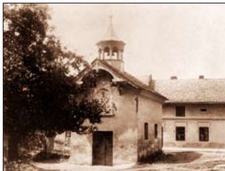
Na fotografii vpravo kaple sv. Anny, vlevo stará zvonice se sochou sv. Floriana

Roku 1899 bylo založeno kostelní družstvo, jehož snahou bylo kostel postavit a za tímto účelem shromáždit dostatek finančních prostředků. Začít stavět se mělo již v roce 1914, osloven byl kroměřížský architekt R. Sprindrich. Plány však zhatila 1. světová válka. Kostel měl být ve srovnání s tím současným prostornější a slohově bohatší. Základní kámen nynějšího kostela byl položen 15. srpna 1924. Stavělo se podle plánů Ing. Met. Matušky, architekta v Bystřici p. Host.