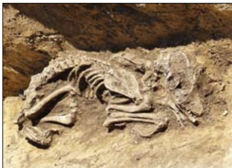
Kostra psa na dně titulu

Ve stejné době jako římský krátkodobý tábor bylo odkryto i polykulturní pravěké naleziště s osídlením od starší