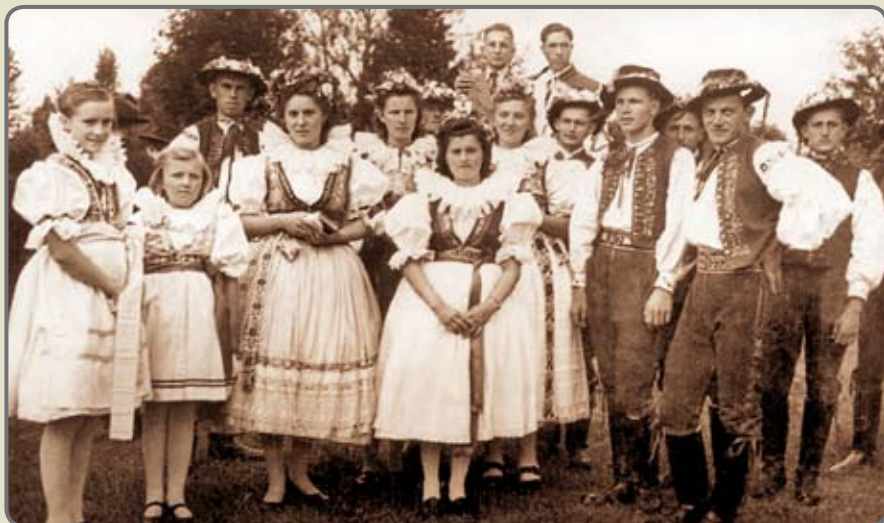
Hanáci; fotografii zapůjčil Milan Rozkošný

Má Haná! Mužsky tvrdá v zimě a žensky kyprá přes léto! Sen o tobě zas probouzí mě... „Tož nebuď hloupé, poeto,