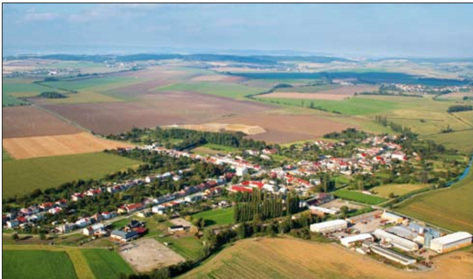
Obec v říjnu roku 2010

Název obce vysvětluje odborná literatura jako ves lidí Právkových nebo Pravcových, jelikož název vznikl od osobního jména Právek. Podle všeho jde o jedinou obec tohoto názvu. Známa pískovcová brána – skalní most v Děčínské vrchovině zvaný Pravčická brána – je od Pravčic vzdálena takřka 300 km a s naší obcí nemá kromě svého názvu společného nic.