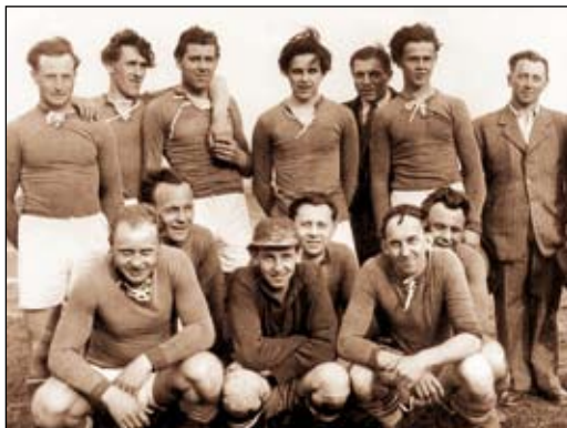
Fotbalové mužstvo z 50. let minulého století

I v dalších letech mužstva mužů i dorostů hrála se střídavými úspěchy v různých třídách a soutěžích v rámci okresu a nejbližšího okolí. Tyto soutěže se však v prvních letech často měnily, a tak se postupně tvořily skupiny jako 2. třída sever B, 2. třída okres Holešov apod. Hned v roce 1947 vyhrály Pravčice svou skupinu. Klub také pořádal letní turnaj a první dva