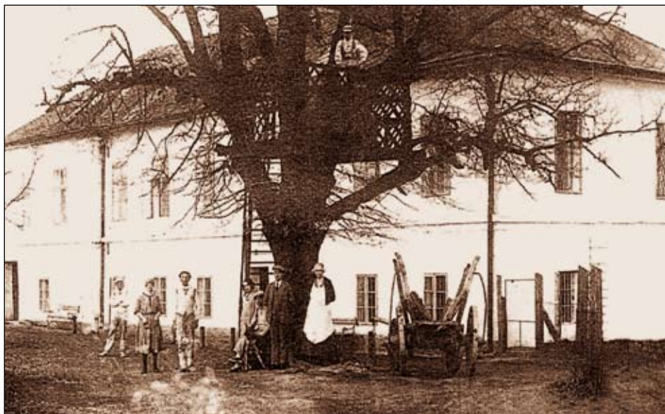
Bývalý pravčický mlýn s legendární besídkou v koruně košaté lípy

Základní kámen mlýna byl ponechán a uložen při vstupu do jezdeckého areálu, který se zde nyní nachází. Poblíž lze dohledat i staré mlýnské kameny z objektu mlýna prapůvodního, v minulosti zničeného požárem.