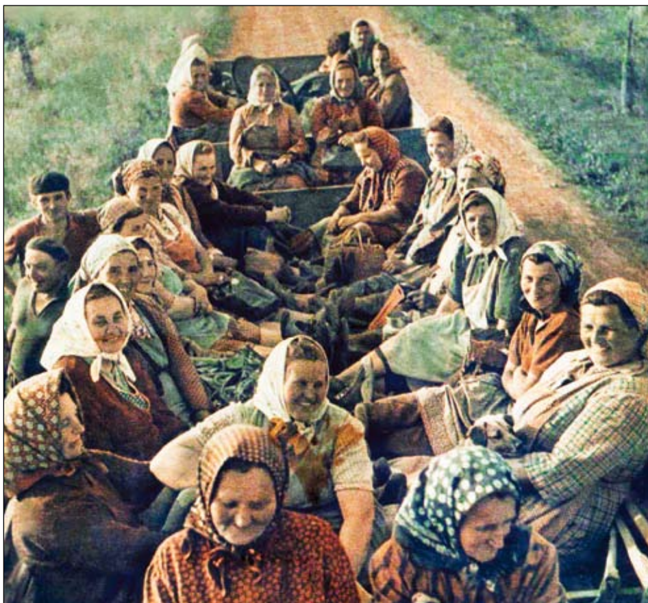
Členové JZD na fotografii z titulní strany 27. čísla „Besedy“, venkovským novin, vydaných 5. července 1957

V současné době sídlí v pravčickém areálu bývalého zemědělského družstva společnost Pravčická a.s., která se zabývá rostlinnou a živočišnou výrobou a která spolu s dalšími soukromými zemědělci obhospodařuje polnosti v okolí obce.