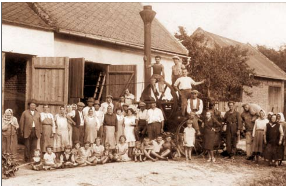
U stodol naproti současné autobusové zastávky (ulice vedoucí k rozcestí) s lokomobилоu (damfem), která poháněla mlátičku