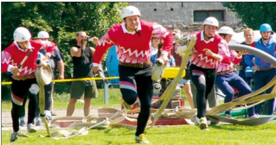
Úspěšná sportovní družstva hasičů