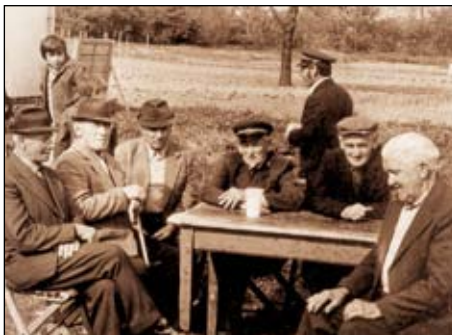
Drobnochovatelé 70. let minulého století