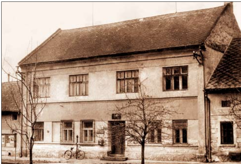
Tzv. „stará škola“ na návsi z doby, kdy v budově sídlila pošta, další prostory byly vyhrazeny klubovně a knihovně