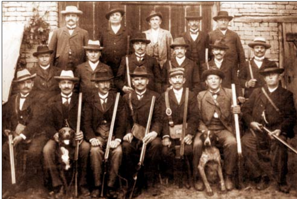
Myslivci se sdružovali i v minulosti, fotografie byla pořízena v roce 1904

Myslivecké sdružení stále svou činností přispívá s péčí dobrého hospodáře k zachování kmenových stavů zvěře a zvelebení kvality chovu. A to ne bez starostí a práce. K úspěchu přispívá nadšení všech členů.