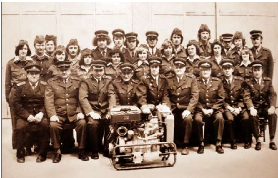
Skupinová fotografie z 80. let minulého století