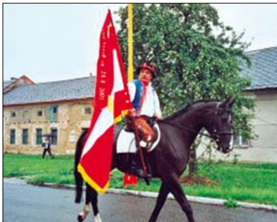
28. 8. 2005 – svěcení obecních symbolů