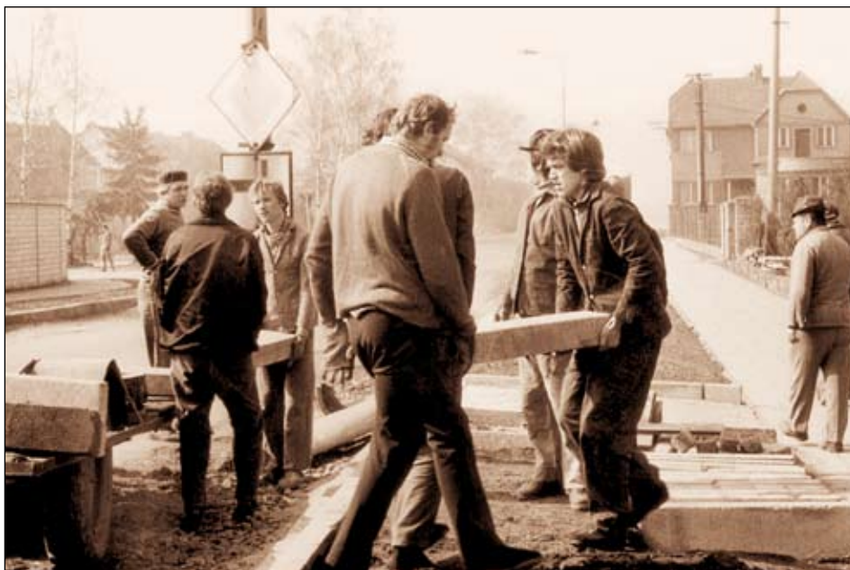
Na fotografiích z 24. 3. 1984 nahoře jarní úklid, dole úprava prostranství před školou