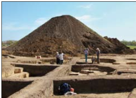
Naleziště 2007 – pravěk