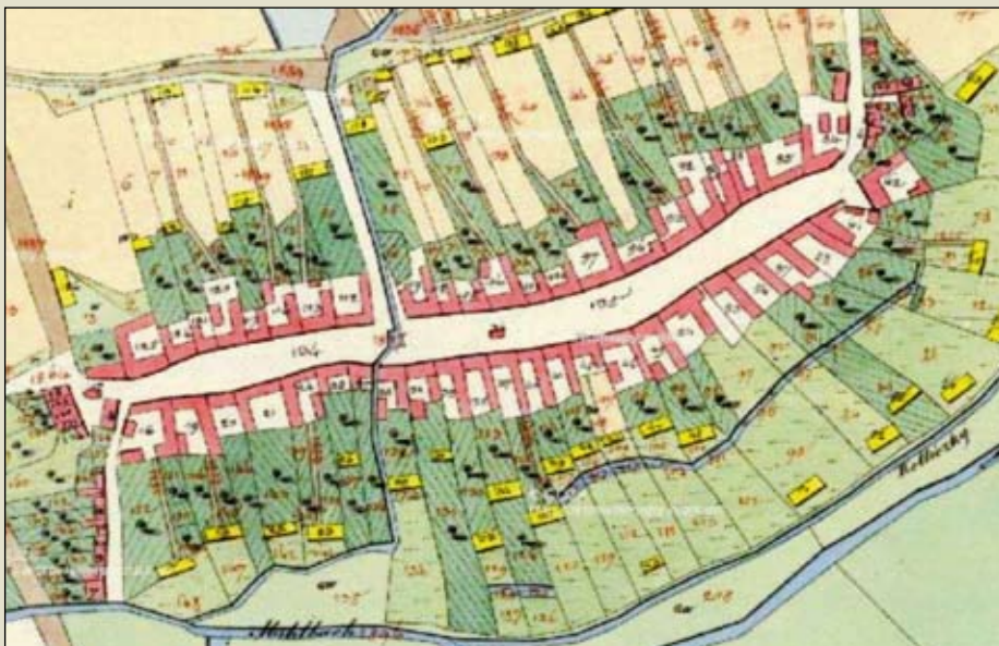
Historická mapa obce Pravčice z roku 1830