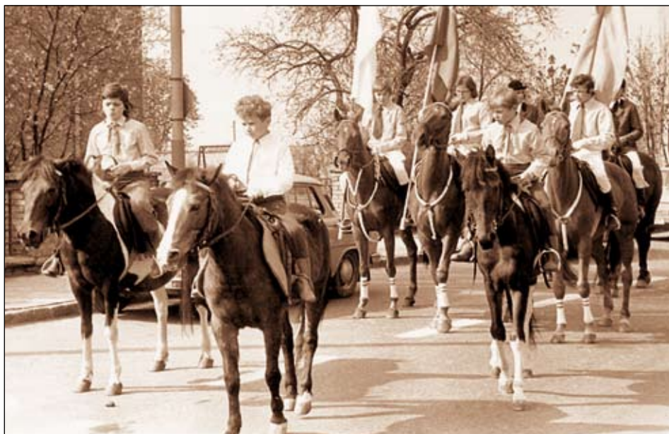
Oslavy 1. máje