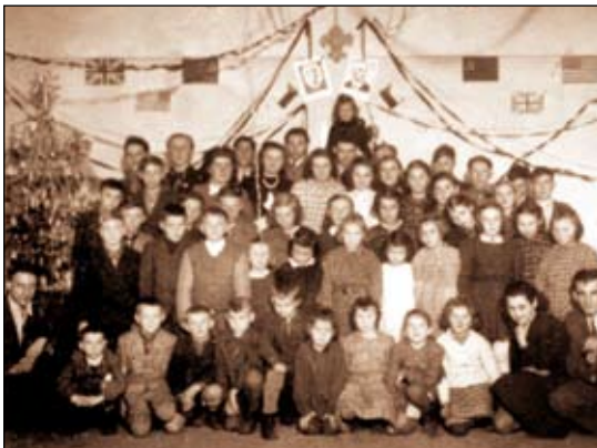
Na fotografii skauti v místnosti současné školní jídelny

Není bezzajímavosti, kdy a proč vzniklo v budově školy mezi kuchyní a jídelnou velké podávací okénko. Někteří si možná ještě pamatují dobu, kdy se v těchto prostorách scházeli krátce po 2. světové válce skauti, kteří v zimním období hráli loutkové divadlo. A právě pro tyto účely okénko vytvořili. Původně šlo tedy o scénu loutkového divadla. V roce 1947 pravčičtí skauti na výstavě skautské činnosti ve skleníku Květné zahrady v Kroměříži se svým divadlem výstavu vyhráli.