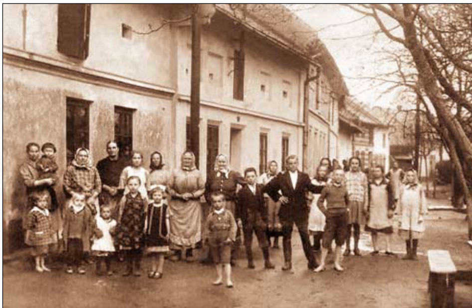
Obyvatelé Žabárny (Růžové ulice) v roce 1924