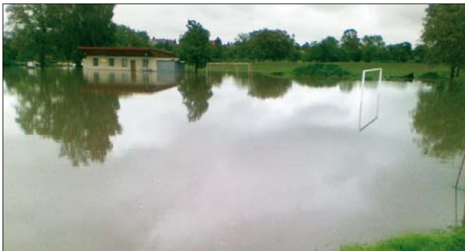
... a někdy je vody moc (květnové povodně roku 2010)