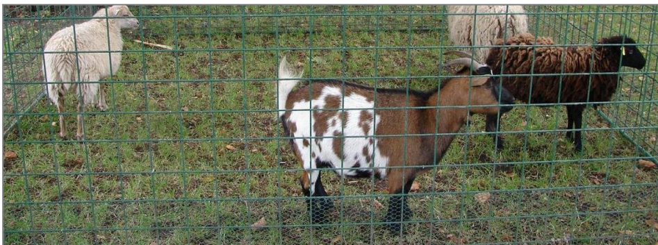
Z výstavy