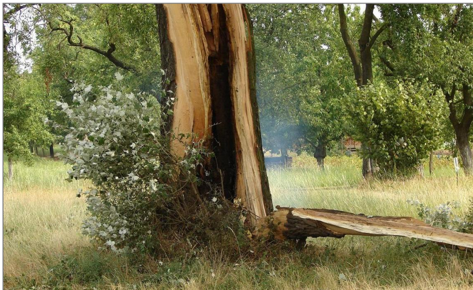
Doutnající kmen bleskem zasaženého stromu