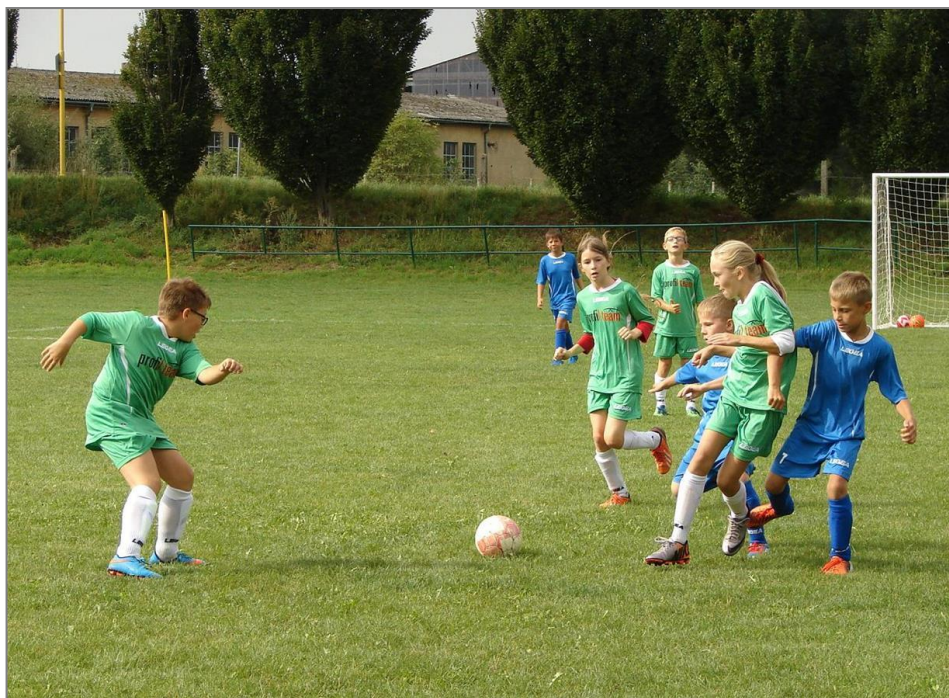
Hráči starší přípravky proti družstvu Hulína

V pondělí 7. září rovněž poprvé v sezóně nastoupili naši nejmladší v turnaji v Holešově, proti týmům Holešov C a Slavkov.