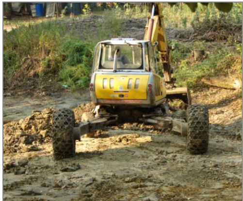
Čištění dna rybníka

Říká se, že všechno špatné je k něčemu dobré. Platí to kupodivu i na letošní sucho. Předpokládám, že jste si většinou všimli, že se čistí rybník Hliník. Podařilo se provést akci, na kterou jsme čekali několik let. Pro letošní rok se podařilo získat dotaci ze Státního fondu životního prostředí ČR v rámci Operačního programu Životní prostředí.