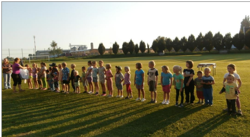
Rozdávání dárečků

Pěkný den byl zakončen opékáním špekáčků a rozdělení drobných dáreků pro všechny děti. Všem pořadatelům, pomocníkům a sponzorům děkujeme.