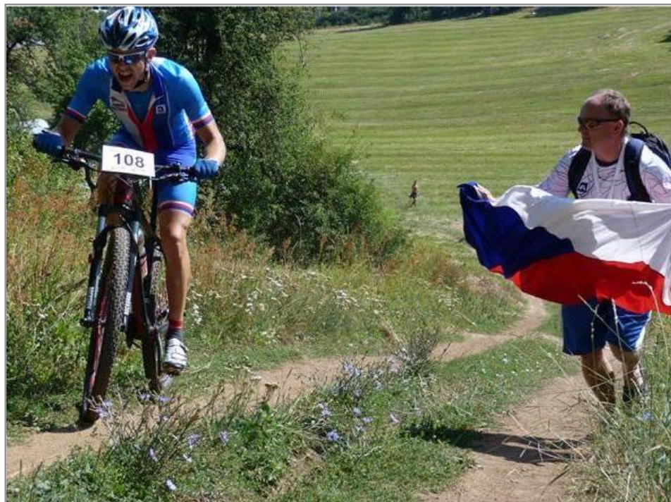
David na olympijské trati

Gratulujeme a přejeme hodně sil do tréninku na další soutěže.