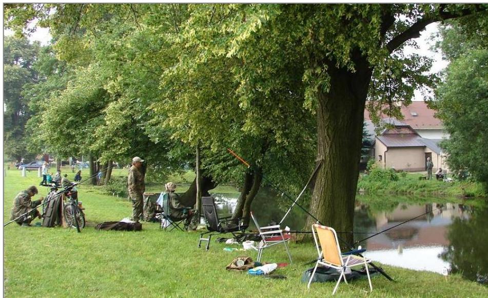
Rybáři u Hliníka

V den závodů krásně svítilo sluníčko, které přilákalo početné návštěvníky. Někteří se přišli jen tak podívat, některé přilákaly rybí speciality, studené pití nebo bohatá tombola s 86 cenami, někteří dělali doprovod závodníkům.