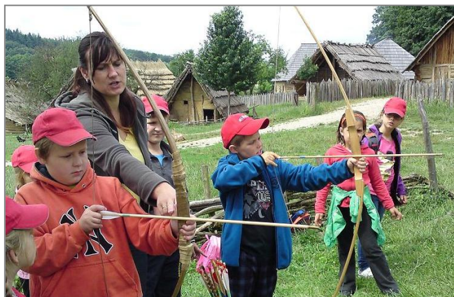
V Archeoskanzenu

Den před vysvědčením jsme se jeli podívat do Archeoskanzenu v Modré u Velehradu na to, jak bydleli naši prapra...prapředkové. Bez problémů jsme dorazili autobusem až na místo.