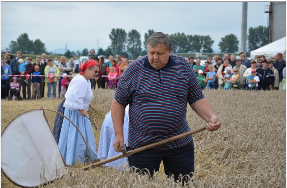
Hejtmán Zlínského kraje se osvědčil i jako sekáč