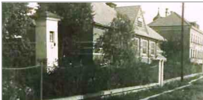
Zleva kaplička, Sokolovna a škola

Tolik z vyprávění pamětníků, které historici a archiváři často označují za velice nepřesné, ale na druhé straně doporučují zaznamenávat i vyložené pověsti. Proto jsem informace, které se vztahují ke kapličce u sokolovny, napsal.