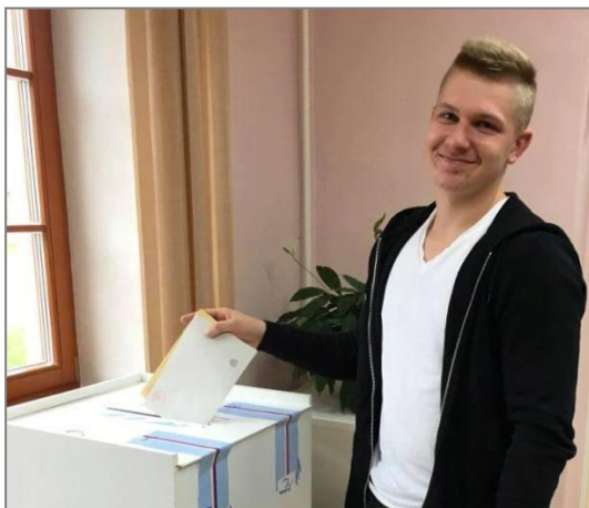
U volební schránky v Pravčicích