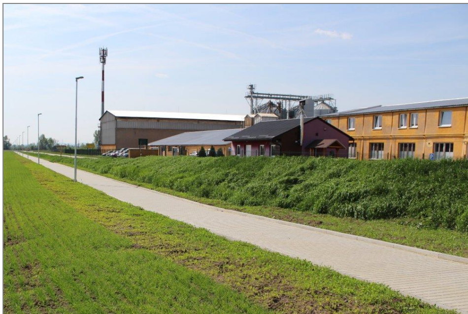
Chodník na rozcestí