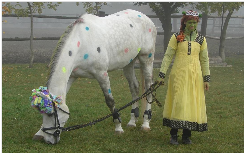
Princezna Fiona