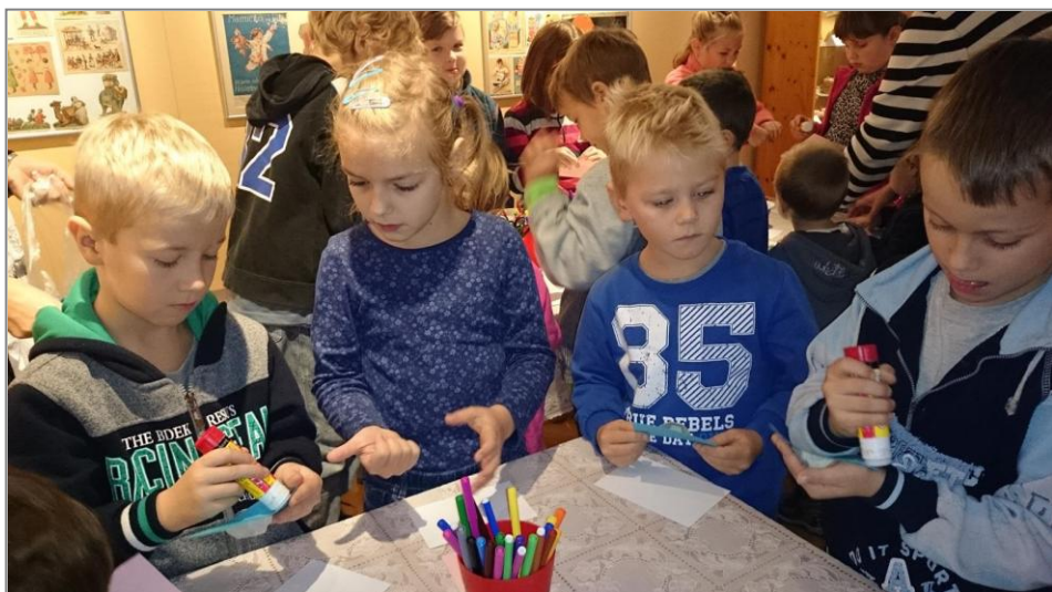
V Muzeu Kroměřížska