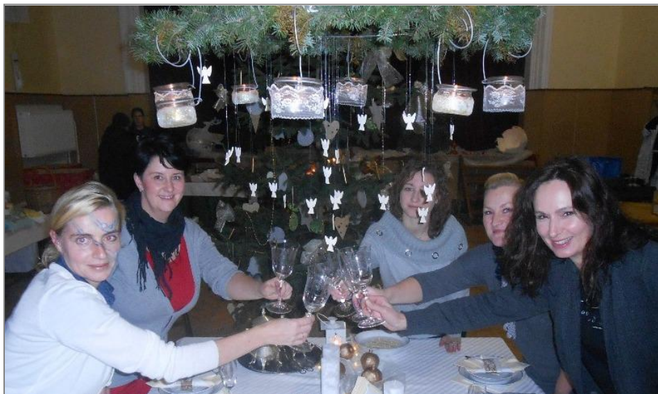
Na fotografii pořadatelky výstavy