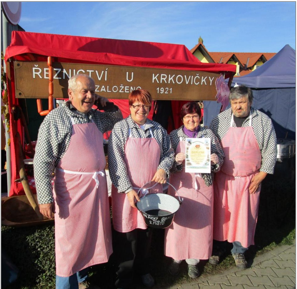
Stříbrný tým