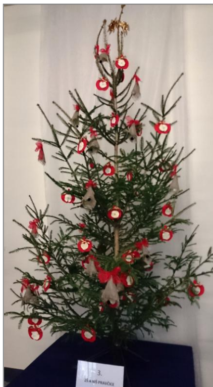
Vpravo náš bronzový vánoční stromeček