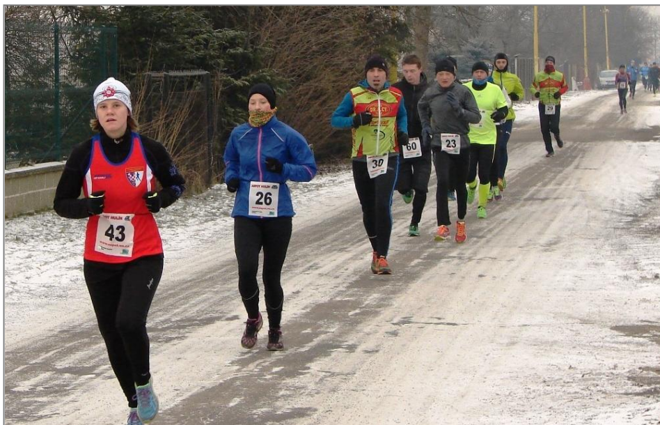
V ulicích Pravčic

Poručíme větru dešti, to už tu kdysi bylo a nějak se to nepovedlo. Asi udělali soudruzi někde chybu a doteď se ji nepodařilo najít. http://www.bezvabeh.cz