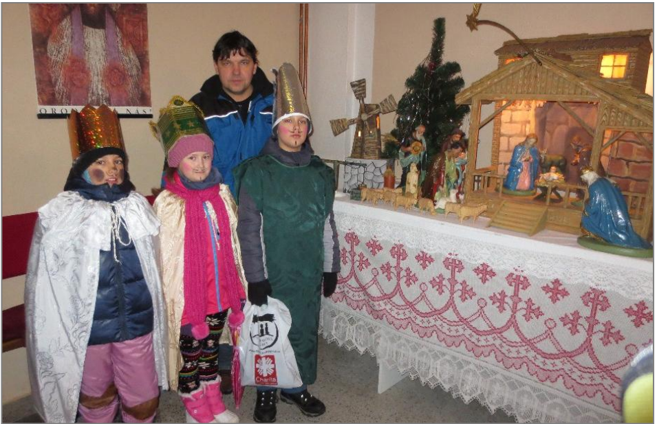
Zdroj: Eva Štefková, Arcidiecézní charita Olomouc, http://www.acho.charita.cz Jedna ze skupinek Tří králů v pravčickém kostele (foto J. Darebníková)