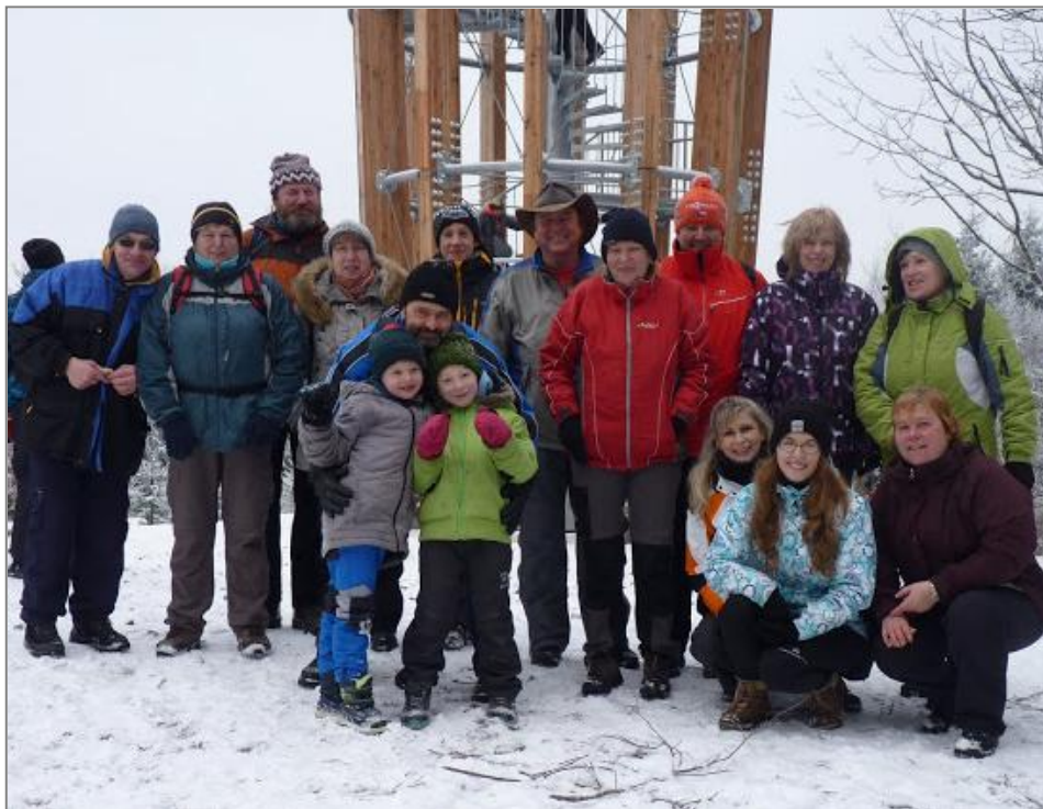
Pravčičtí turisté před rozhlednou na Kelčském Javorníku