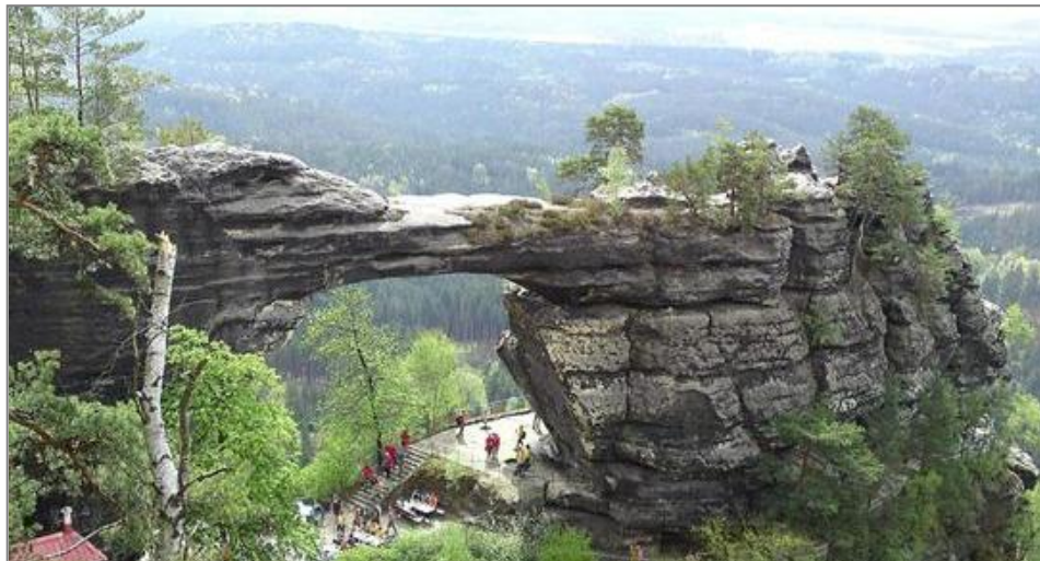
Pravčická brána

Původ názvu největšího skalního mostu ve střední Evropě nazvaného Pravčická brána zajímá snad každého Pravčičáka, zvláště také mě, protože vím, že jiné Pravčice, než ty naše, nejsou.