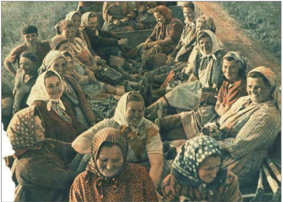
Fotografie z titulní strany časopisu Beseda venkovské rodiny z 5. července 1957